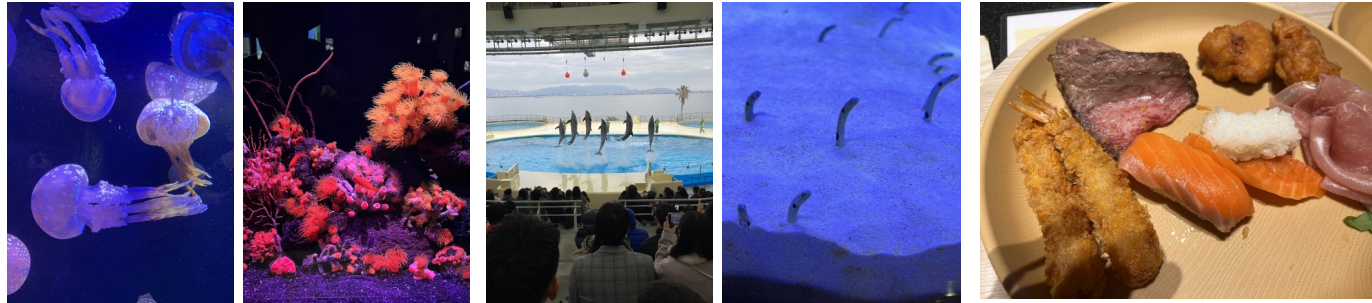
マリンワールド海の中道